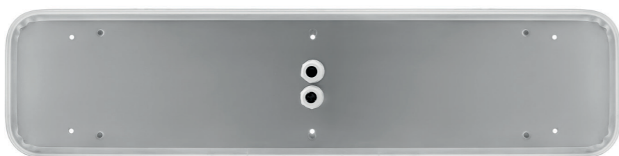
KLM61 2100 LED вид сзади