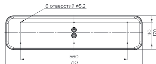
KLM61 2100 LED