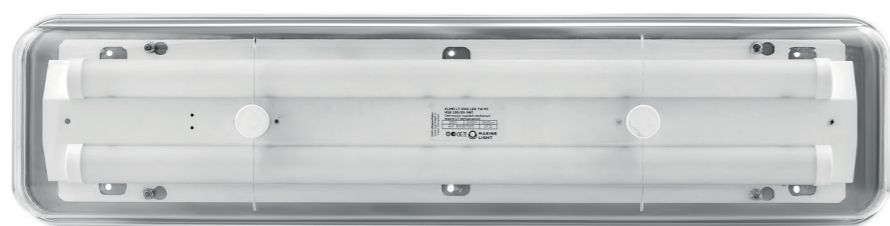
KLM61 2100 LED